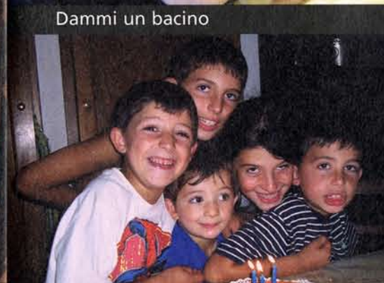
La festa della vita che unisce i fratelli