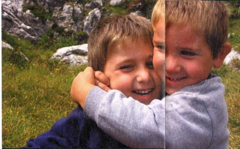
Ti perdono, ormai sei mio fratello

La prova sono le foto che pubblichiamo in queste pagine, tratte da una mostra che la comunità di San Bartolomeo in Tuto ha organizzato a metà aprile in occasione della festa parrocchiale della famiglia. Ogni nucleo ha offerto scatti del proprio album di famiglia. Non sono immagini "posate" ma scatti autentici, ricchi di significato. E con tanti, bellissimi, contagiosi sorrisi. Grazie Scandicci. ♦