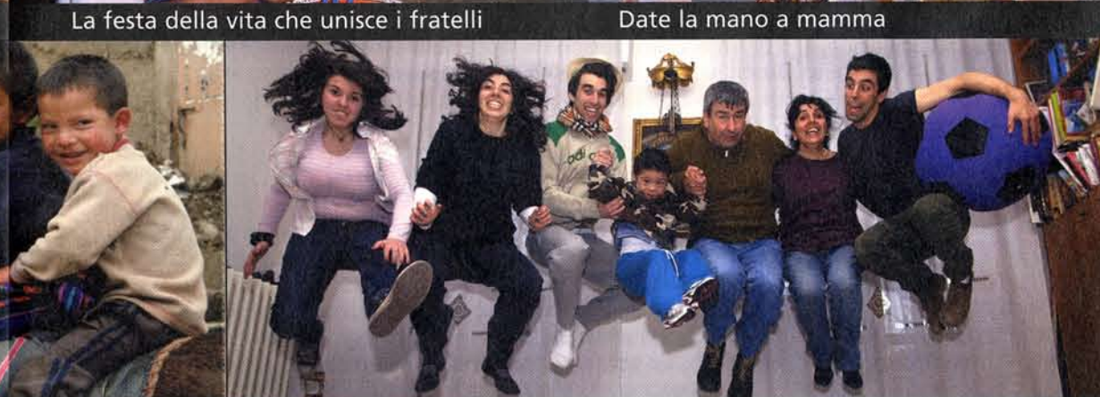
Sette salti di felicità