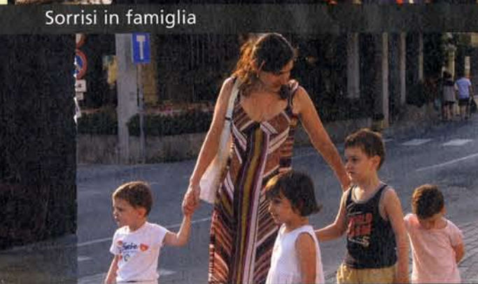
Date la mano a mamma