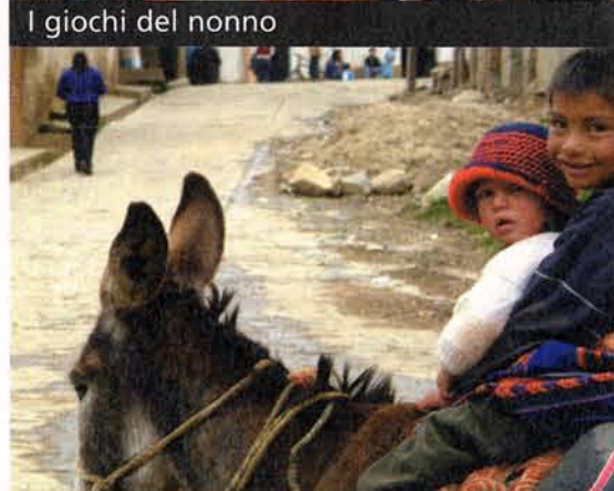
I figli sono anche a distanza