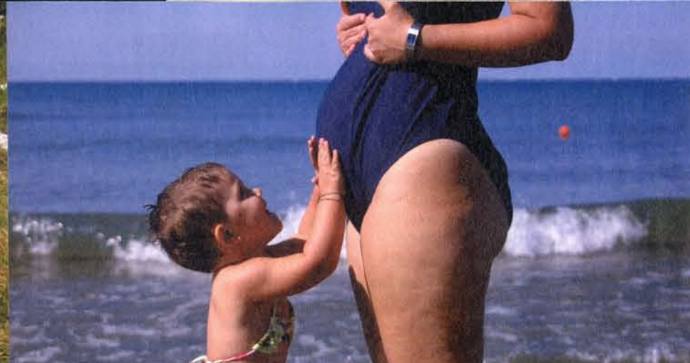
Le gioie della vita