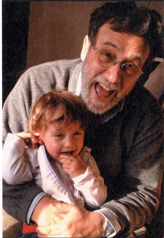
I giochi del nonno