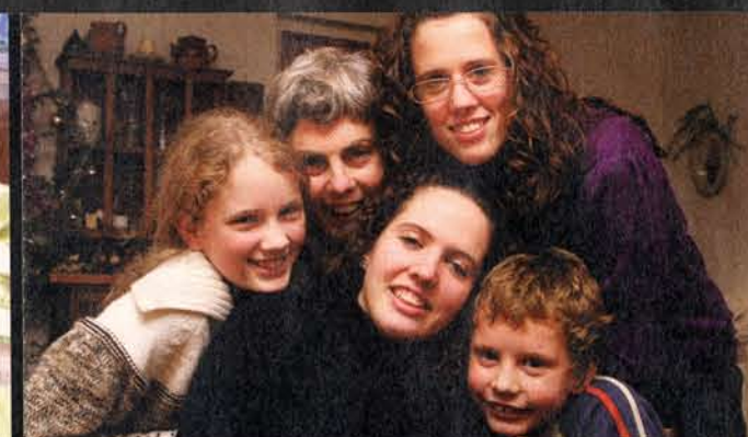
Sorrisi in famiglia